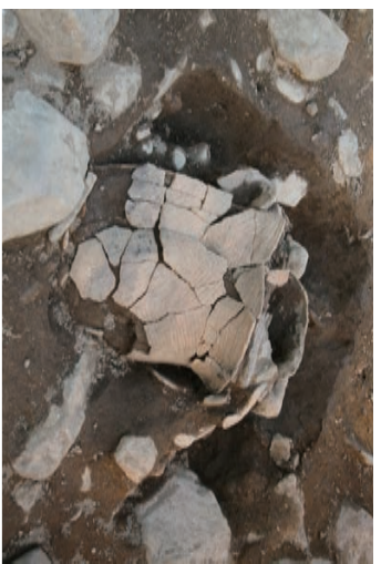
066SK上部覆う土器除去後

◎ 縄文時代晩期後葉(約3000年前)～弥生時代前期(約2500年前)の土器棺墓を確認した。3ヶ所。