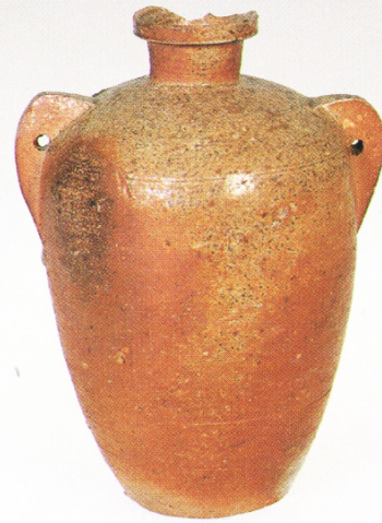
原始灰釉双耳瓶（昭和 63 年度調査出土）