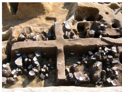
2006 年度調査 江戸時代 （19 世紀前葉）の土坑（492SK）