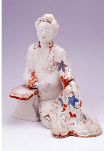
色絵婦人座像（平成 2 年度調査出土）