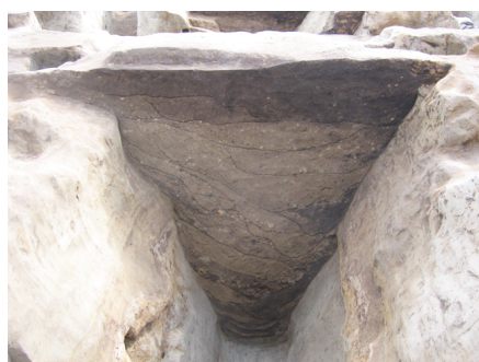
戦国時代（16 世紀代）の堀断面 （605SD:2006 年度調査）

今回は、名古屋城三の丸遺跡の古代、那古野城期の中世・戦国時代、名古屋城三之丸期の江戸時代の 3 つの時代の発掘調査の成果を中心に展示を行います。