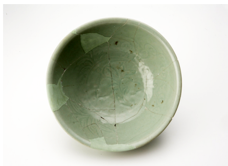
江戸時代（19 世紀前葉）の 土坑（492SK）出土青磁鉢