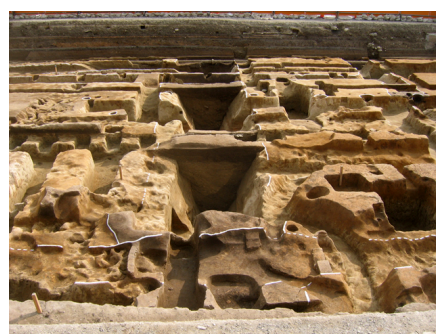
戦国時代（16 世紀代）の堀全景 （605SD:2006 年度調査）