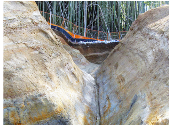
桑下城跡の堀の断面