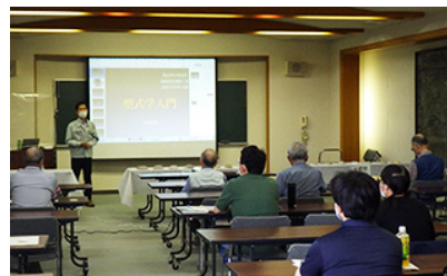
▲歴史講座：講座の様子