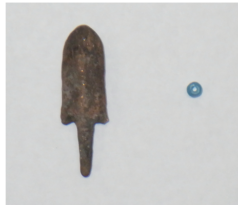
銅製の矢尻・ガラス小玉（古墳時代前期）