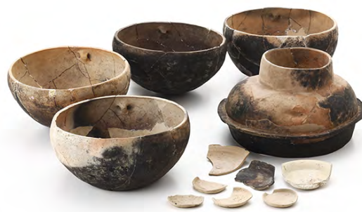
出土した鍋のいろいろな形