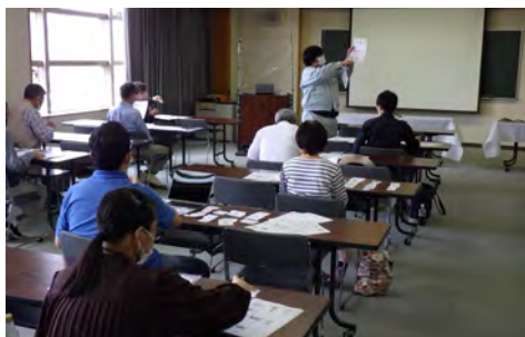
▲ 解説の風景 ▲