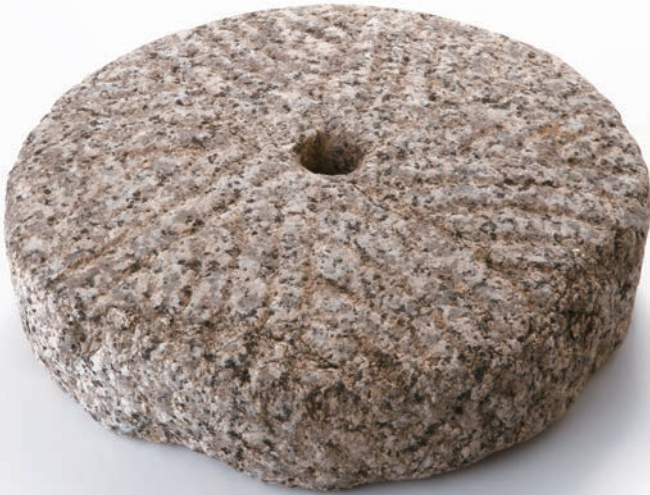
石臼【下臼】(瀬戸市桑下城跡)【戦国期】

石の道具が、考古遺物として扱われる場合、これらは "石器" とか "石製品" などと呼ばれます。一般的に、"石器" は特に実用的な性格の強いものについてのもを指し、"石製品" は装飾性および精神性の強いものについて呼ばれることが多いようです。本展示では、これら "石の道具" を、愛知県下で出土した資料を用いて、後期旧石器時代から通史的に展示しています。