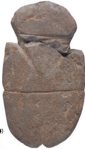
岩偶岩版類 (名古屋市牛牧遺跡) 【縄文時代】