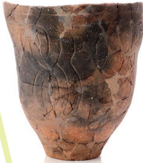
深鉢 (新城市モリ下遺跡)【縄文時代】

石の道具が、考古遺物として扱われる場合、これらは "石器" とか "石製品" などと呼ばれます。一般的に、"石器" は特に実用的な性格の強いものについてのもを指し、"石製品" は装飾性および精神性の強いものについて呼ばれることが多いようです。本展示では、これら "石の道具" を、愛知県下で出土した資料を用いて、後期旧石器時代から通史的に展示しています。