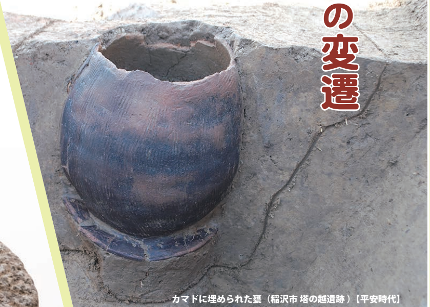
カマドに埋められた甕 (稲沢市塔の越遺跡)【平安時代】