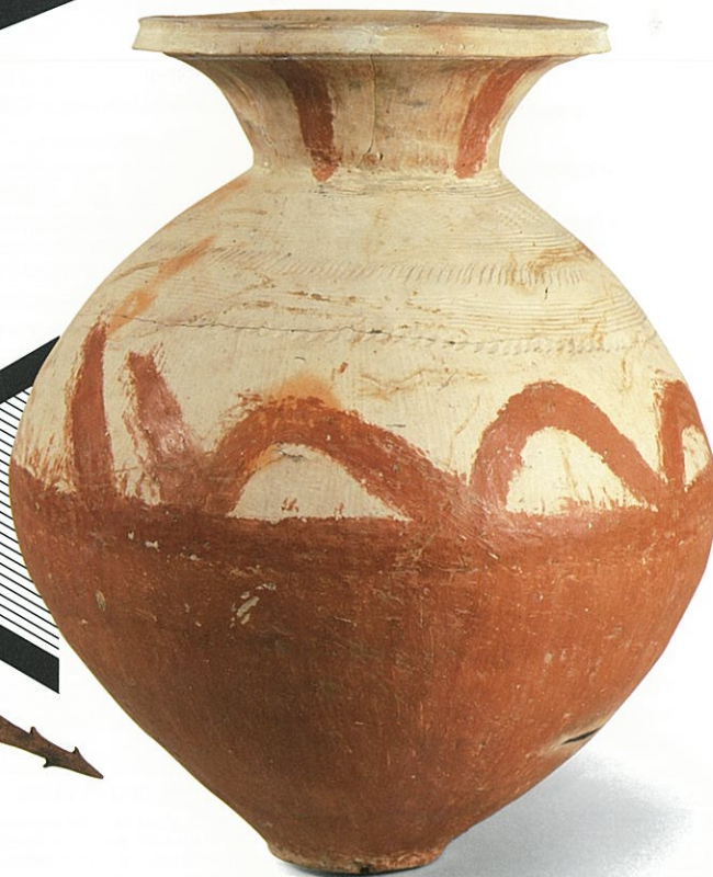
Asahi Site - Caravansary of 2000 years ago -