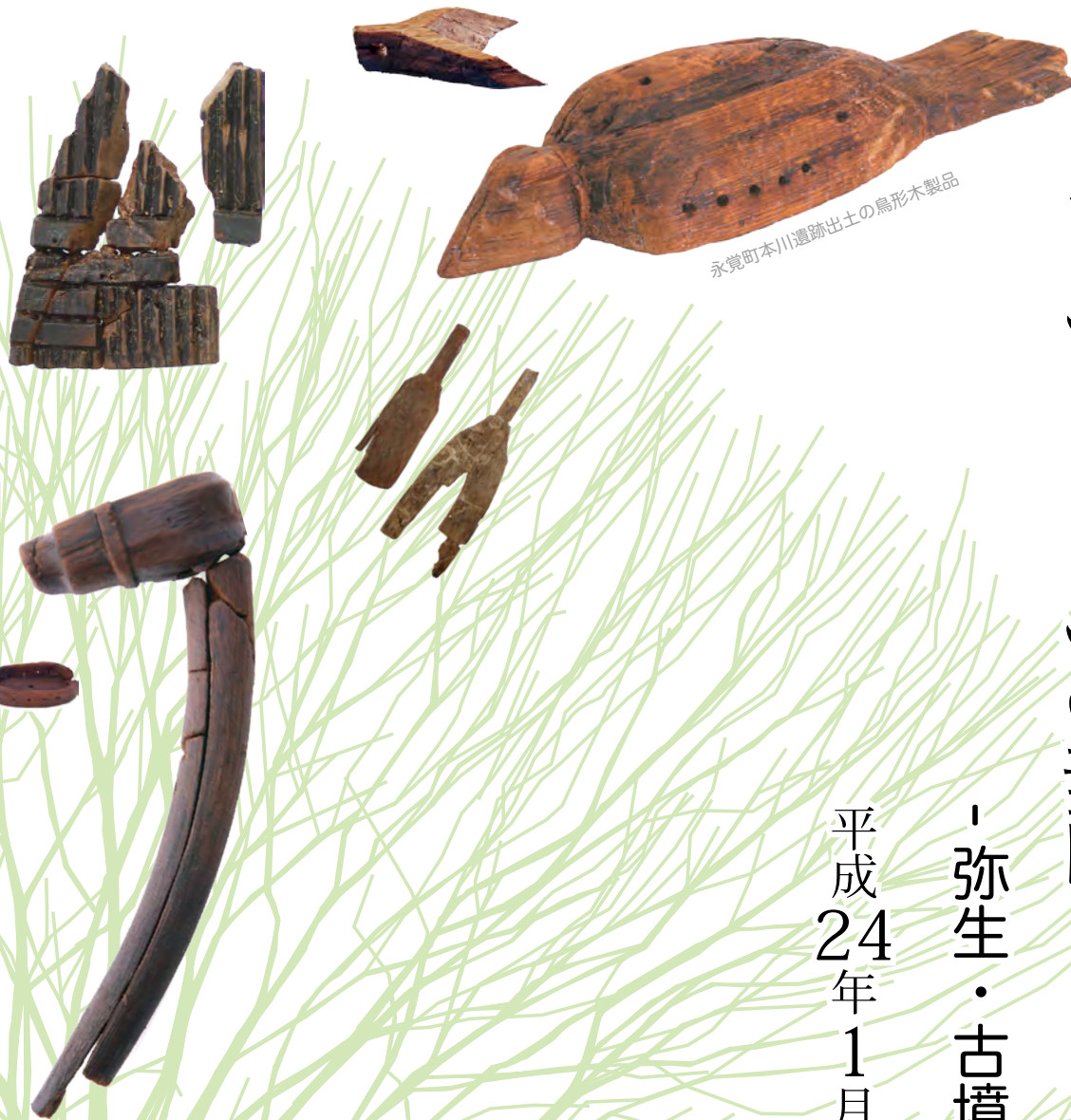
永覚町本川遺跡出土の鳥形木製品