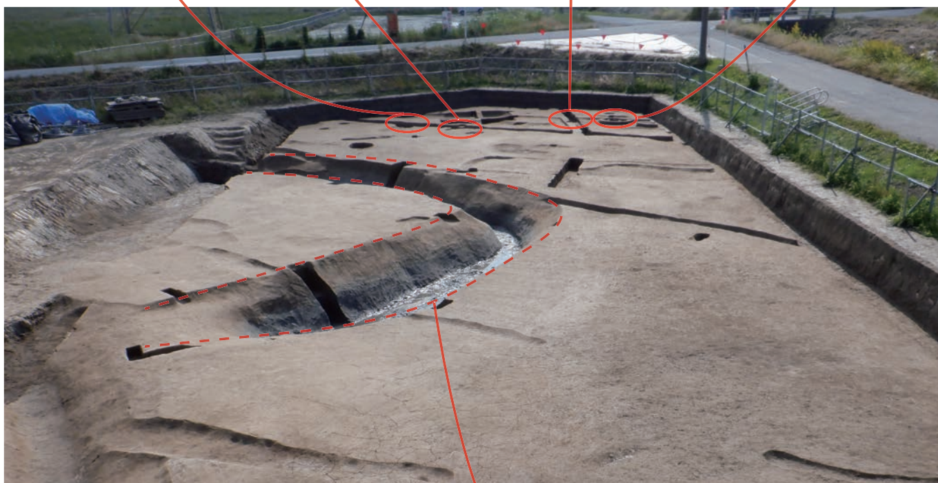
一辺約18mの方形周溝墓の周溝