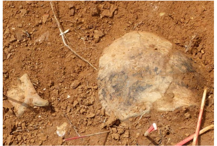
弥生土器の出土状況