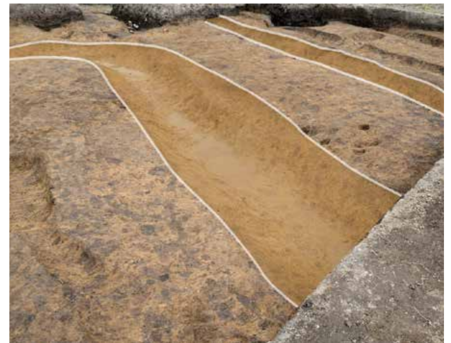
大きく曲がる溝（室町時代）

このほか、26Ea 区の西端では古墳時代の土師器や須恵器 すえき が出土しはじめています。今後、西側にも調査を展開していく予定ですので、乞うご期待です。