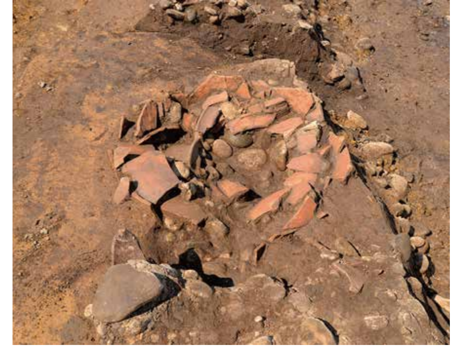
とこなめやき おおがめ 道の真下で見つかった常滑焼の大甕