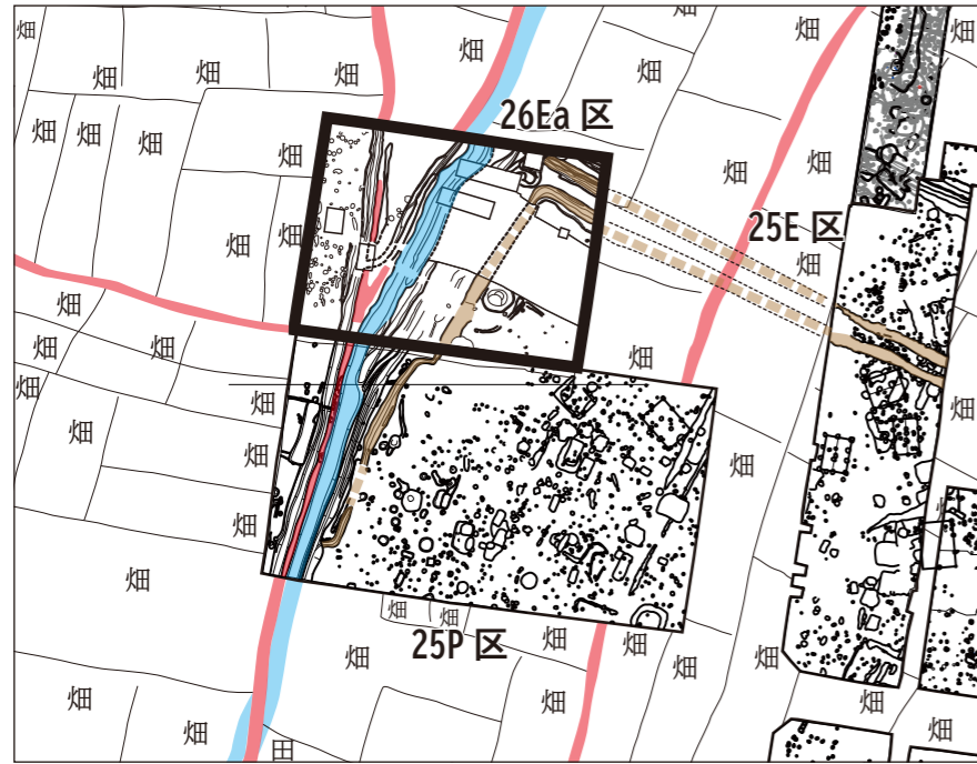
道 水路 室町時代の溝 調査区と明治時代の地籍図