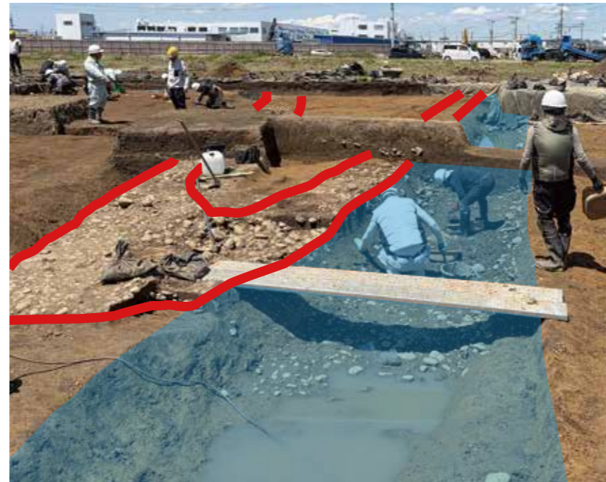
道 水路 石を敷いた道と水路