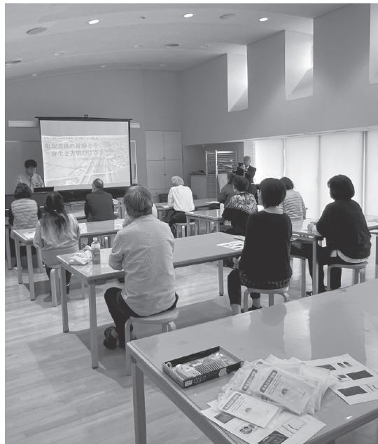
講座の様子（安城市民ギャラリー創作実習室にて）

安城市での開催時はアンケートでも初参加という回答が多く、センター以外での開催は、広く一般県民に公開するという当講座の目的を達するに有効な施策だったといえる。（河嶋優輝）