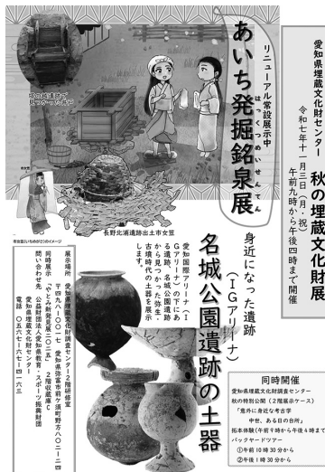
「あいち発掘銘泉展」チラシ