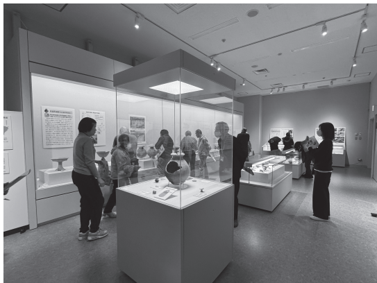
企画展示室の展示状況