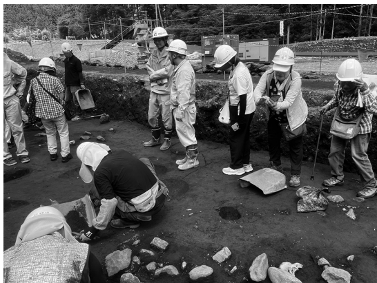
下延坂遺跡見学会