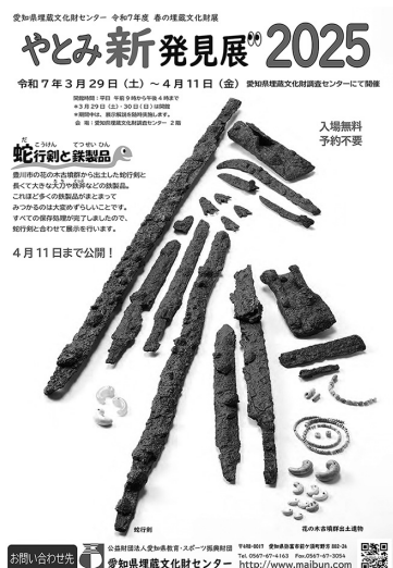
「やとみ新発見展」2025」チラシ

配布資料として埋文桜ニュースを発行し、遺跡の概要説明と本年度イベント案内および愛知県埋蔵文化財調査センター春の特別公開の展示解説を掲載した。期間中の配布部数は254部。（武部真木）