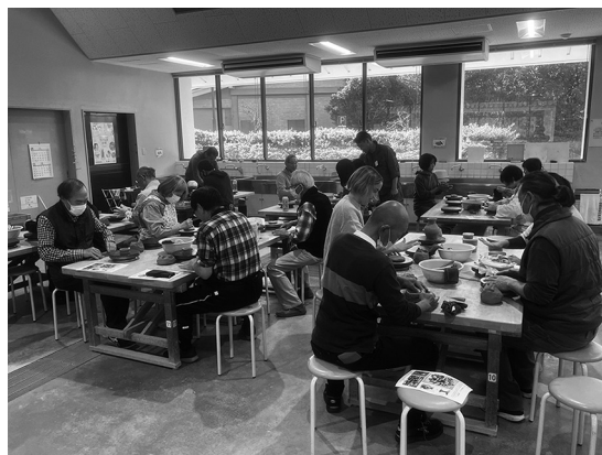
ワークショップ「パレススタイル土器を作ろう」 土器製作