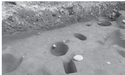
25A区 竪穴建物跡083SI完掘状況(北西より)