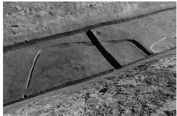
A区下面竪穴建物完掘状況