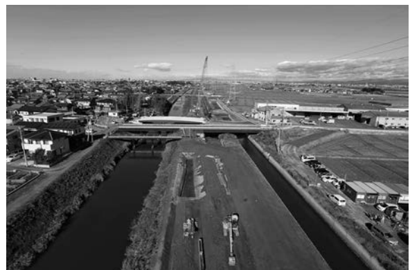
調査区遠景(南より)