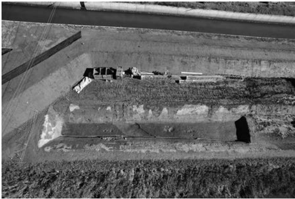
A区上面全景(西より)