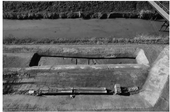
A区下面全景(東より)