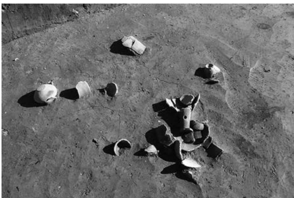
A区下面遺物出土状況