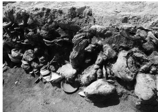
002SY 前庭部灰原検出状況