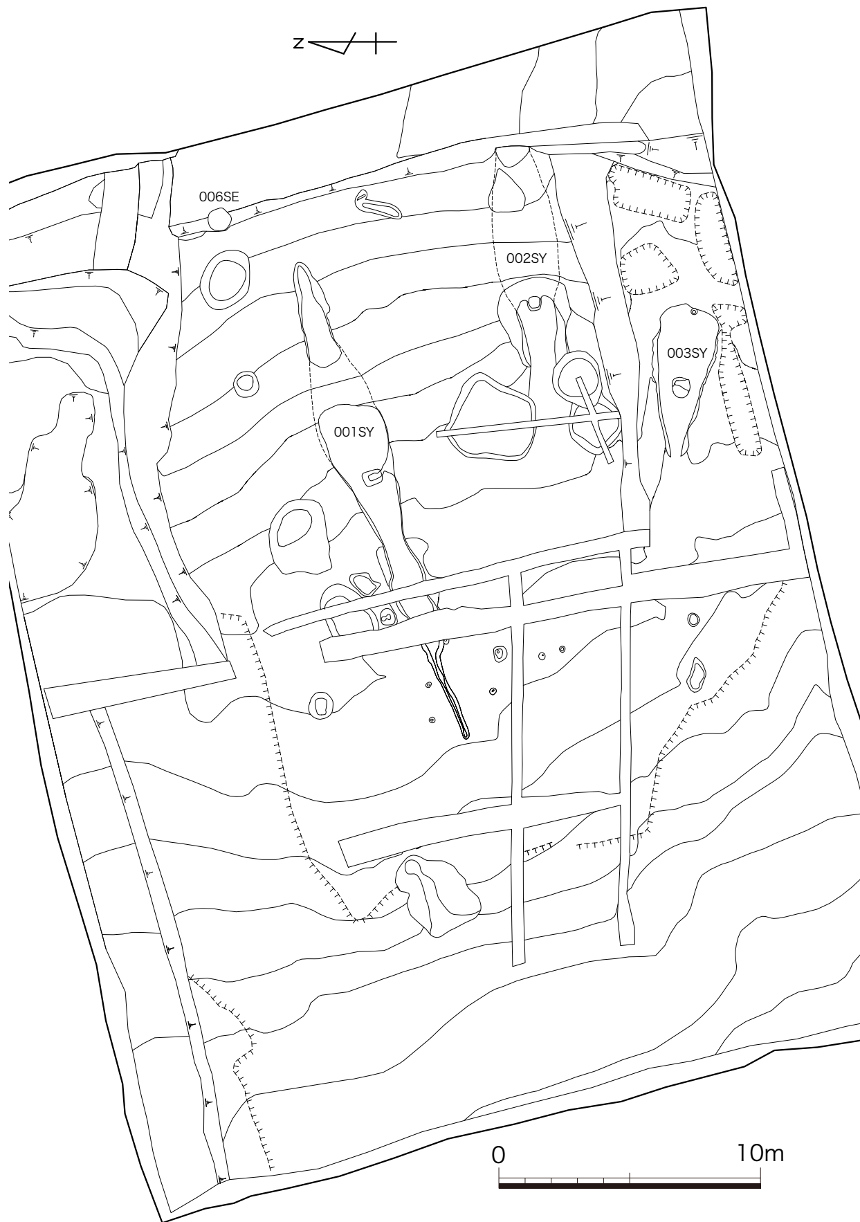
別岨古窯遺構全体図(1:200)