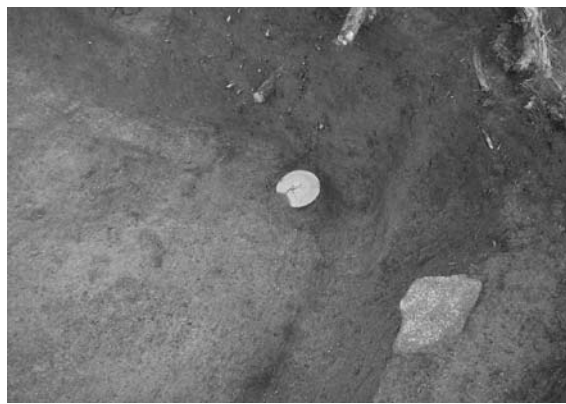
竪穴住居 019SI出土遺物