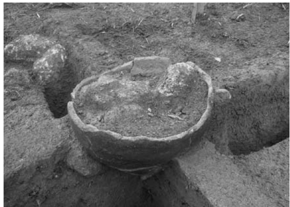
礫群O1SS中に埋設された土器