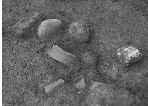
竪穴住居 121SI出土遺物