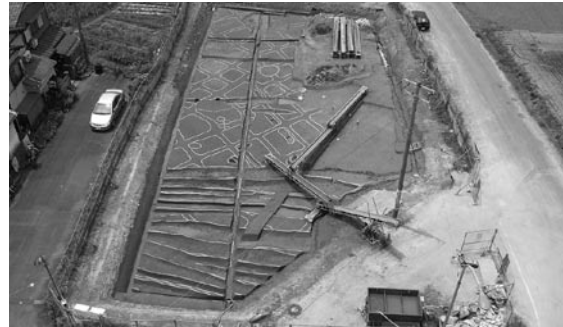
江戸時代の水田遺構（06D区東より）