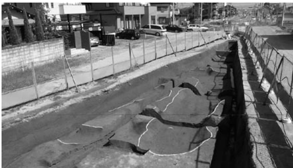
古墳時代前期の方墳（06Cb区西より）