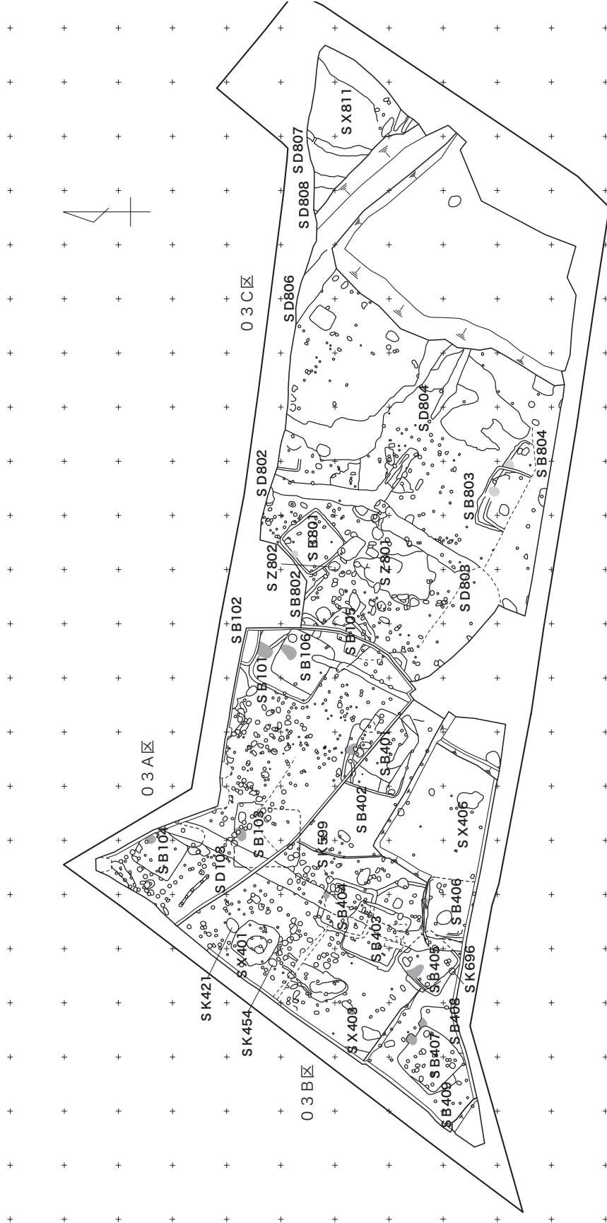
小針遺跡遺構位置図 (1:500)