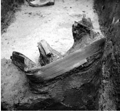
S X 8001 出土の曲物