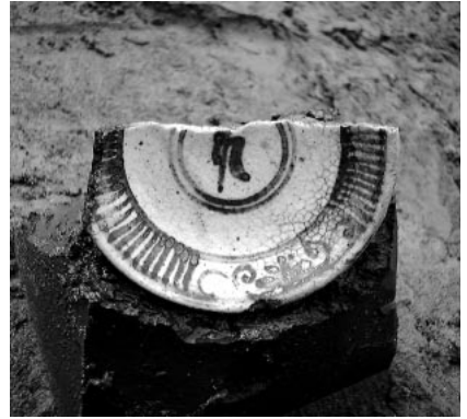
S X 8001 出土の鉄絵小皿