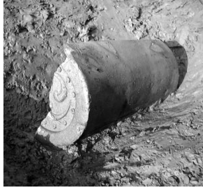
S X 8001 出土の軒丸瓦