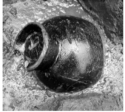
S X 8001 出土の漆塗椀