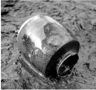
S X 8001 出土の茶入れ