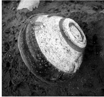
S X 8001 出土の天目茶碗