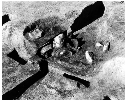
A区 竪穴住居カマド