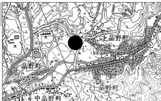
調査地点(1/2.5万「多治見・猿投山」)

調査の経過 調査は国道363号線の改良工事に伴う事前調査として、愛知県建設部より愛知県教育委員会を通じた委託事業として昨年度より実施している。本年度は2,000㎡を、A・B区の2つの調査区に分割して実施した。調査期間は平成12年10月から12月である。