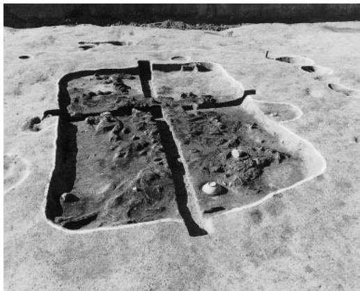
A区 竪穴住居 (東より)