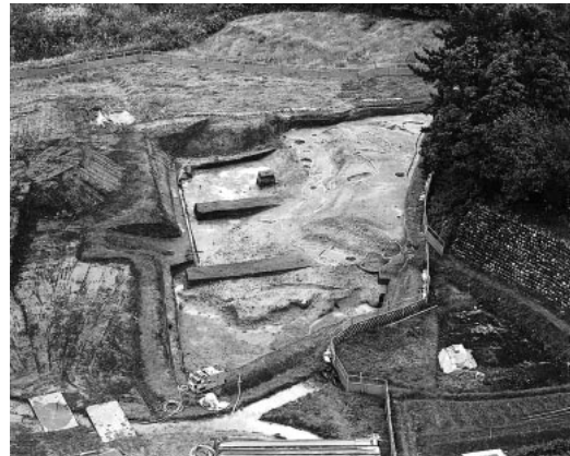
B区 全景 (東より)