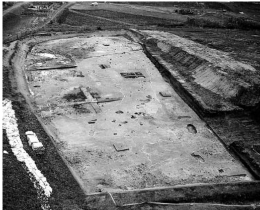
A区 全景 (北より)