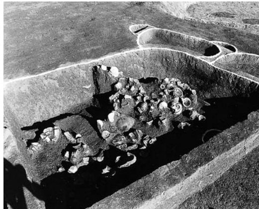
S B 02 東側ブロック遺物出土状況