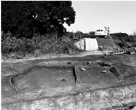
S B 02 全景 南西より