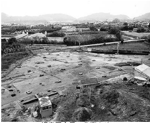
調査区全景 北東より