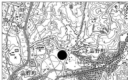
調査地点 (1/2.5 万「多治見」)

所在地 瀬戸市上品野町地内 調査理由 国道 363 号線改良 調査期間 平成 12 年 1 月～3 月 調査面積 1,000 m 2 担当者 北村和宏・宇佐見 守・魚住英史