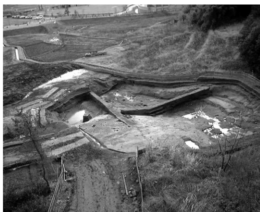
調査区全景 (北東より)

調査の概要 調査区は北東部の丘陵斜面と北西部から南部に広がる自然流路に分かれる。遺構としては山茶椀が出土した土坑などを丘陵斜面で検出した。調査区の大部分を占める自然流路の埋土は長年の土砂の堆積により複雑な層位をしていたが、概ね旧耕作土下の黒褐色土から山茶椀・施釉陶器・木製品など鎌倉から室町時代の遺物が、それからさらに 1 m 程下の青灰色粘質土直上から須恵器・土師器など奈良・平安時代の遺物が出土した。その他の遺物として丘陵斜面上の黄褐色砂礫層から戦国時代の施釉陶器が、その下の青灰色粘質土直上から縄文時代の石鏃・剥片が出土した。 (宇佐見 守)