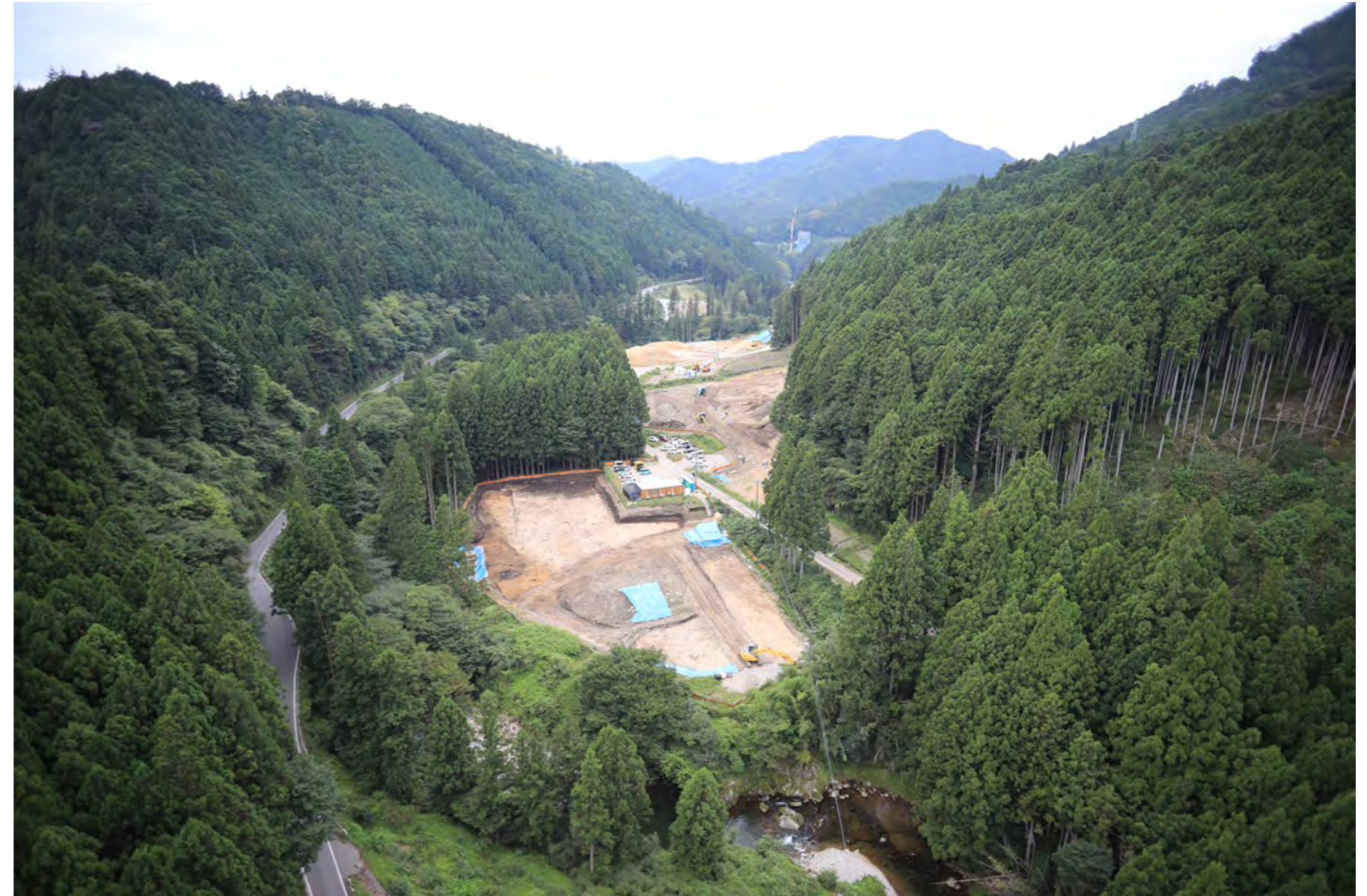
下延坂遺跡遠景(手前:21B・C区 奥:21A区)