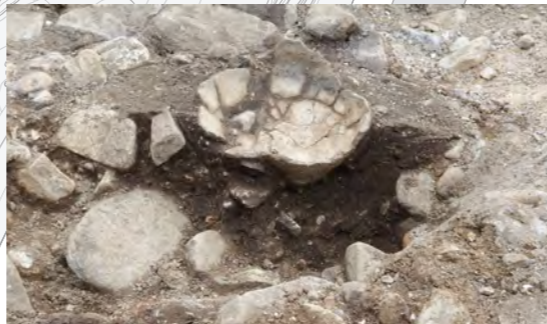
埋甕（縄文時代中期後半）

2箇所の建物跡が見つかり、それぞれに複数の段階が想定されます。出土遺物から縄文時代中期後半（約5000年前）のものと推定されます。