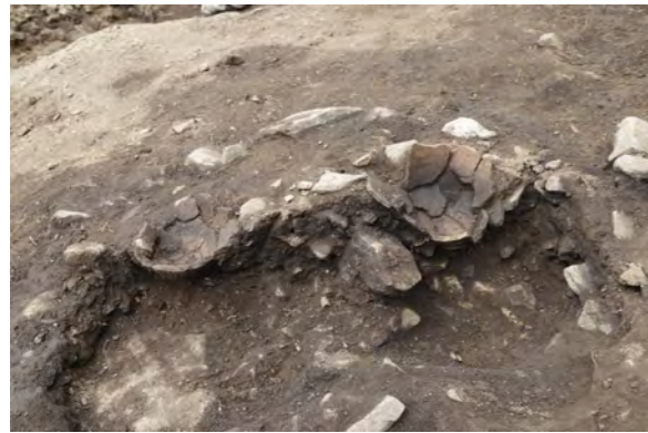
土器埋設遺構（縄文時代晩期） 2つの土器が人為的に埋められた状態で出土しており、お墓などの機能が想定されます。

下延坂遺跡は設楽町川向地区の境川右岸に位置し、昨年 じょうもんじだい に続いて今年度 やよいじだい も発掘調査を実施しました。昨年度は縄文時代晩期～弥生時代前期 たてあなじょういこう の竪穴状遺構が確認されました。今年度は、西側のA区では縄文時代の土器埋設遺構 どきまいせついこう や貯蔵穴 えどじだい さくれつ 、江戸時代の柵列 たてあな たてもものあと うめがめ が見つかり、東側のB区では縄文時代の竪穴建物跡や埋甕 うめがめ が見つかりました。今後調査が行われていくC区でも、同様の遺構が見つかる可能性が考えられます。