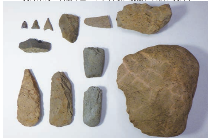
礫素材の石器 (左下から打製石斧、磨製石斧、れつき)