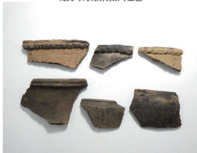
縄文時代晩期後葉の土器