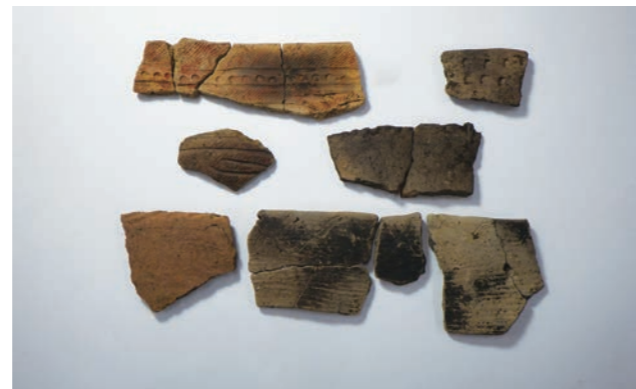
縄文時代晩期前葉～中葉の土器