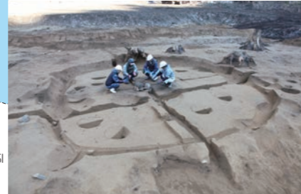
18B区 竪穴建物跡 325SI 縄文時代中期