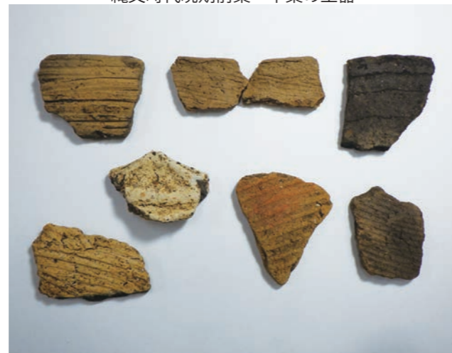
弥生時代前期の土器