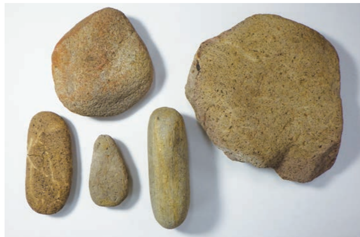
礫素材の石器 (左上からすりいし、たいいし、たたきいし、磨石)