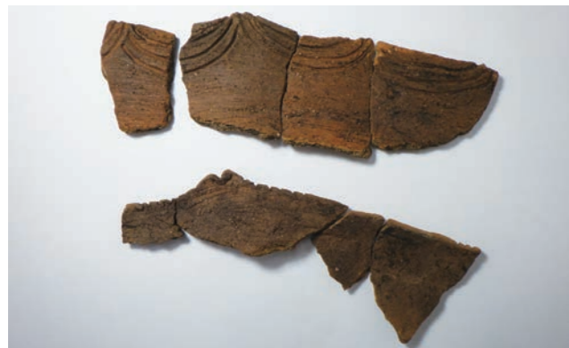
縄文時代晩期初頭の土器