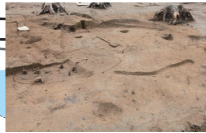
18B区 竪穴建物跡 170SI 縄文時代中期