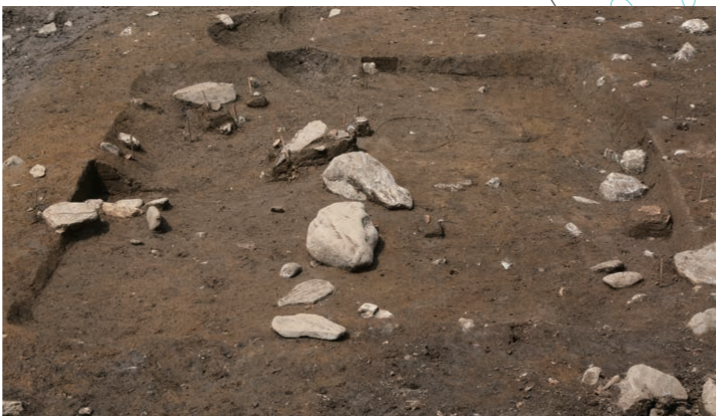
たてあないこう 縄文時代の竪穴遺構(206SK)