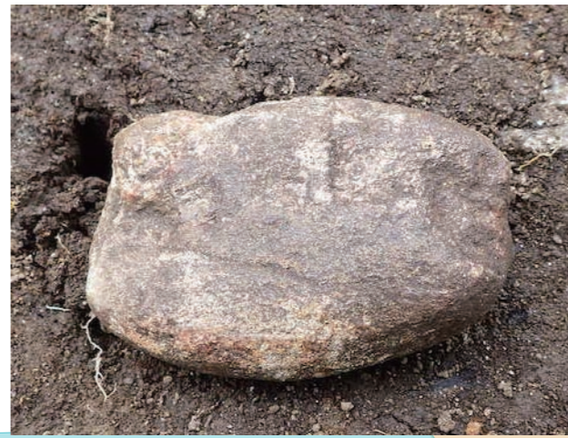
うちきせきすい 打欠石錘 (縄文時代)