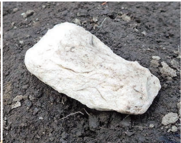
たせいせきふ 打製石斧 (縄文時代)