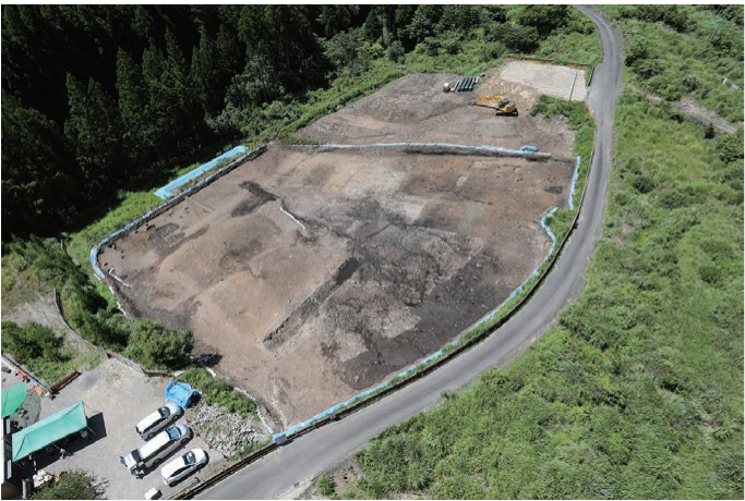
遺跡を北東上空からみる