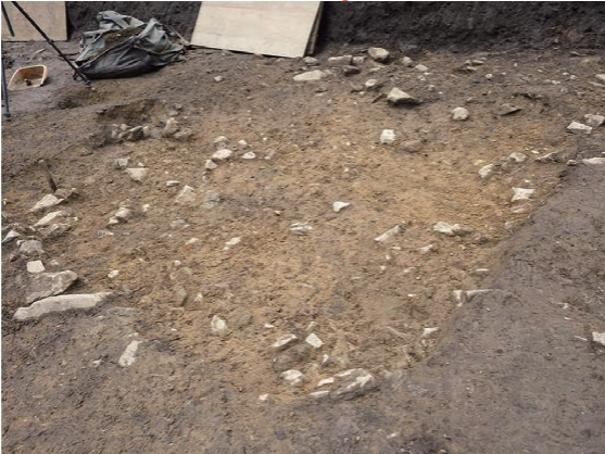
たてあないこう 縄文時代の竪穴遺構(113SK)