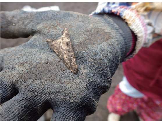
せきぞく 縄文時代の石鍬 (113SK)