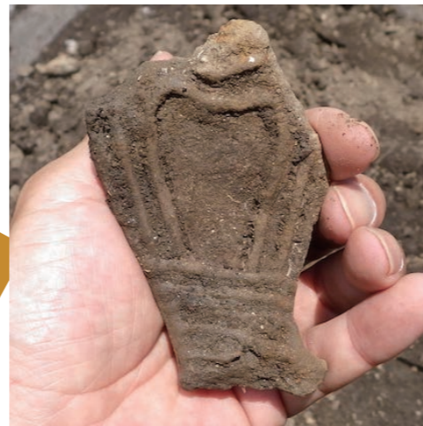
縄文土器 (5000 年前)