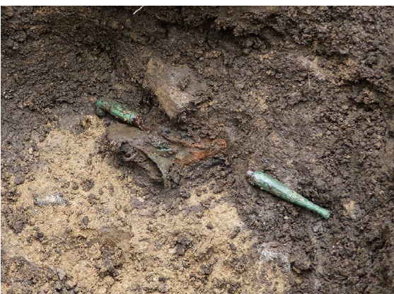
きせる 近世墓から出土した煙管 (083SK)