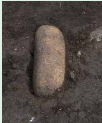
15Bc区石冠出土状態（西より）