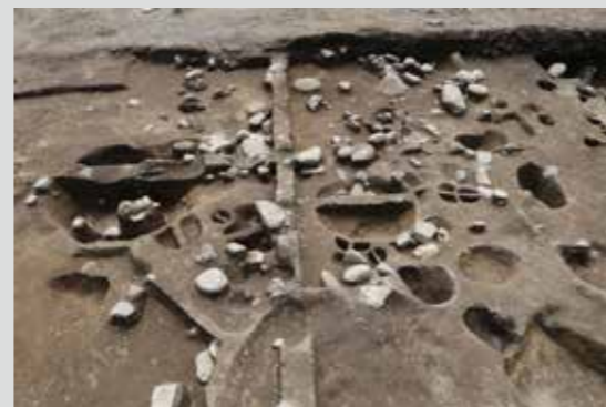
15Ba区竪穴建物1（788SK、北東より）