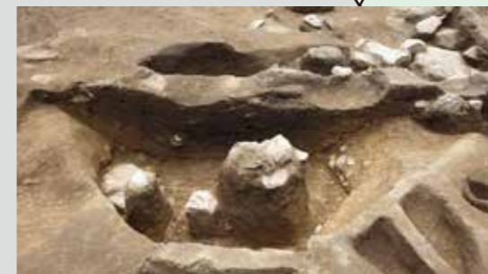
15Ba区土坑3（貯蔵穴、789SK、北東より）