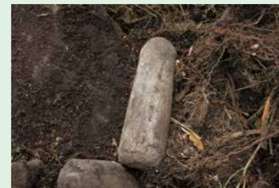
15Bb区石棒出土状態（東より）