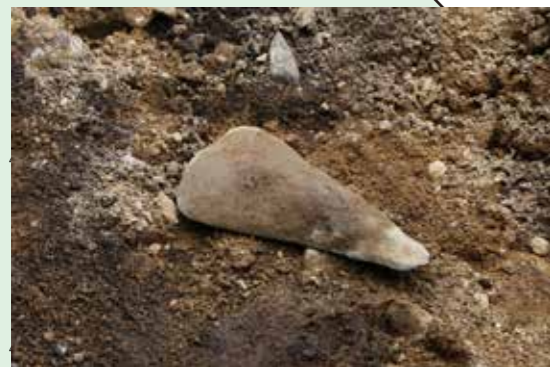
15A区打製石斧出土状態（西より）