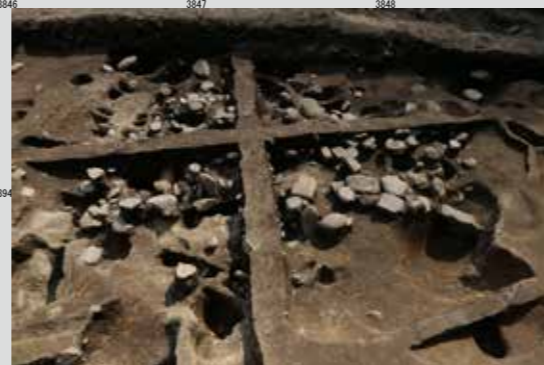
15Ba区竪穴建物2（790SK、北東より）