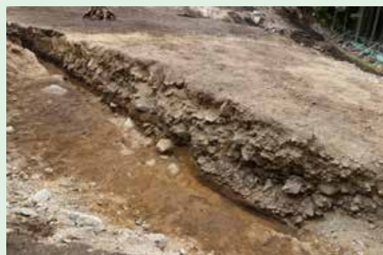
15A区の礫層の断面（北西より）