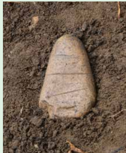
15A区岩版出土状態（西より）