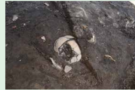
15Ba区の土器棺墓（弥生時代前期）出土状態（西より）